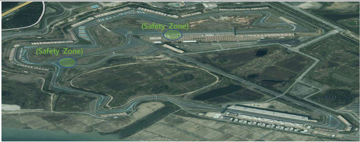
차량트러블시 상설 피트 입구 라바콘, 12.0 상설 서킷