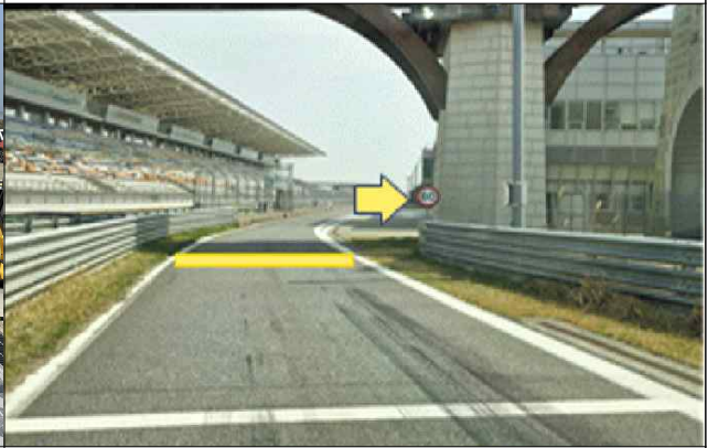
피트입구 속도 시작지점